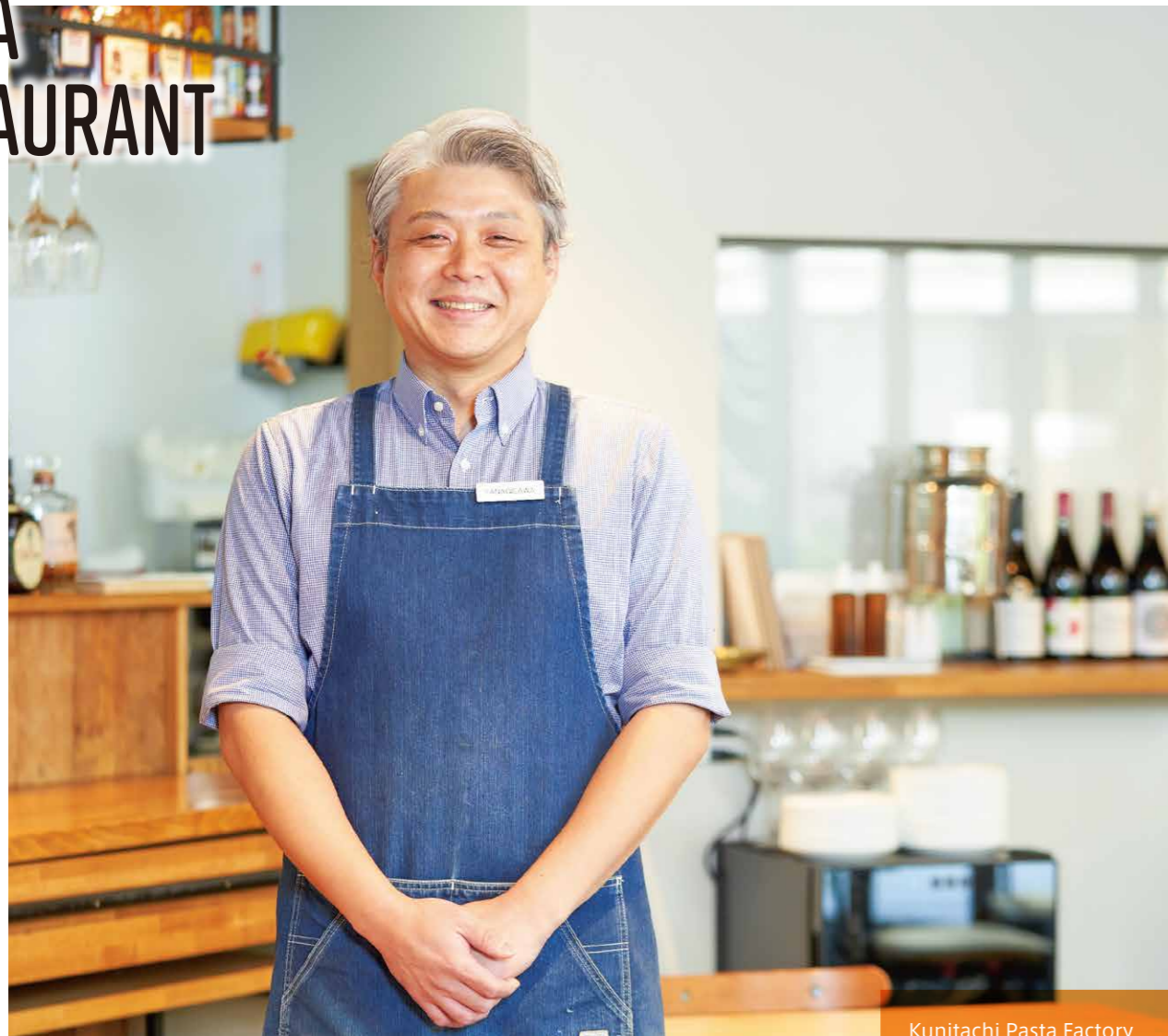
Kunitachi Pasta Factory オーナー