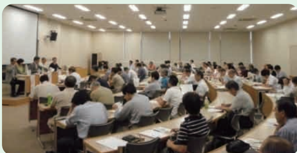
第8回(前回)共同公開講座の様子

お申込みは、Web、 ファクシミリまたは郵送で！ 詳しくは当協会のホームページを ご覧ください